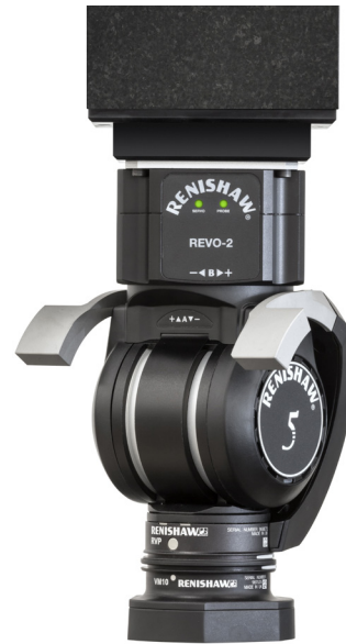
REVO-2 RVP visiontaster met VM10 module

De ATOM is ontworpen om productie- en onderhoudstaken te ondersteunen, met niet te evenaren technische ondersteuning, gestroomlijnde installatie en robuuste kalibratieprocedures. Het eindresultaat: kortere cyclustijden in het proces, hogere opbrengsten per eenheid en lagere productiekosten. De REVO en ATOM zijn toonaangevende producten die nu gecombineerd zijn in de krachtige REVO-2.