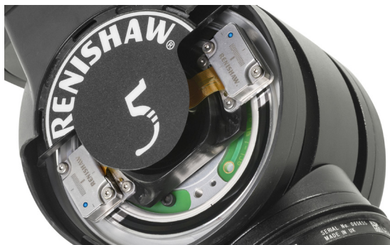
ATOM encoders op REVO-2 meetkop

van twee leeskoppen. Dit draagt bij aan optimale prestaties van de REVO-2, want het elimineert excentriciteitsfouten bij het roteren.